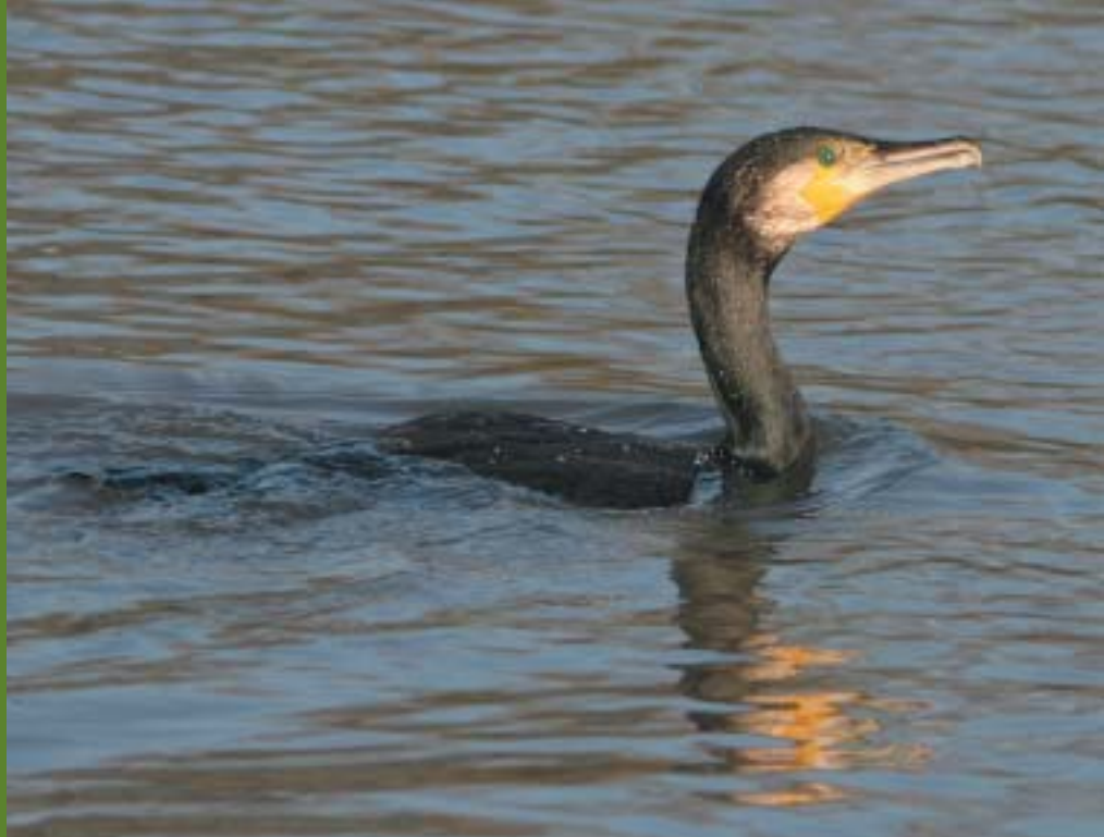
Aalscholver - Koen Devos

Al vele jaren wordt de aantalsontwikkeling van Aalscholvers in Vlaanderen door het INBO op de voet gevolgd, zowel in het broedseizoen als in de winterperiode. Dankzij de medewerking van een groot aantal vrijwilligers en Natuur.Studie zijn de telresultaten voor de periode 2006-2007 nagenoeg 100 % volledig.